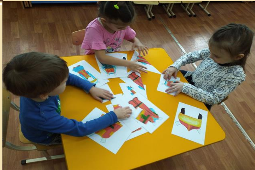
Дидактическая игра «Собери по образцу» (одежда)