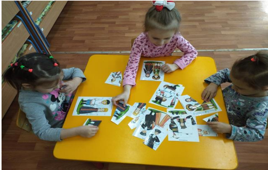
Дидактическая игра «Собери картинку» (народы)